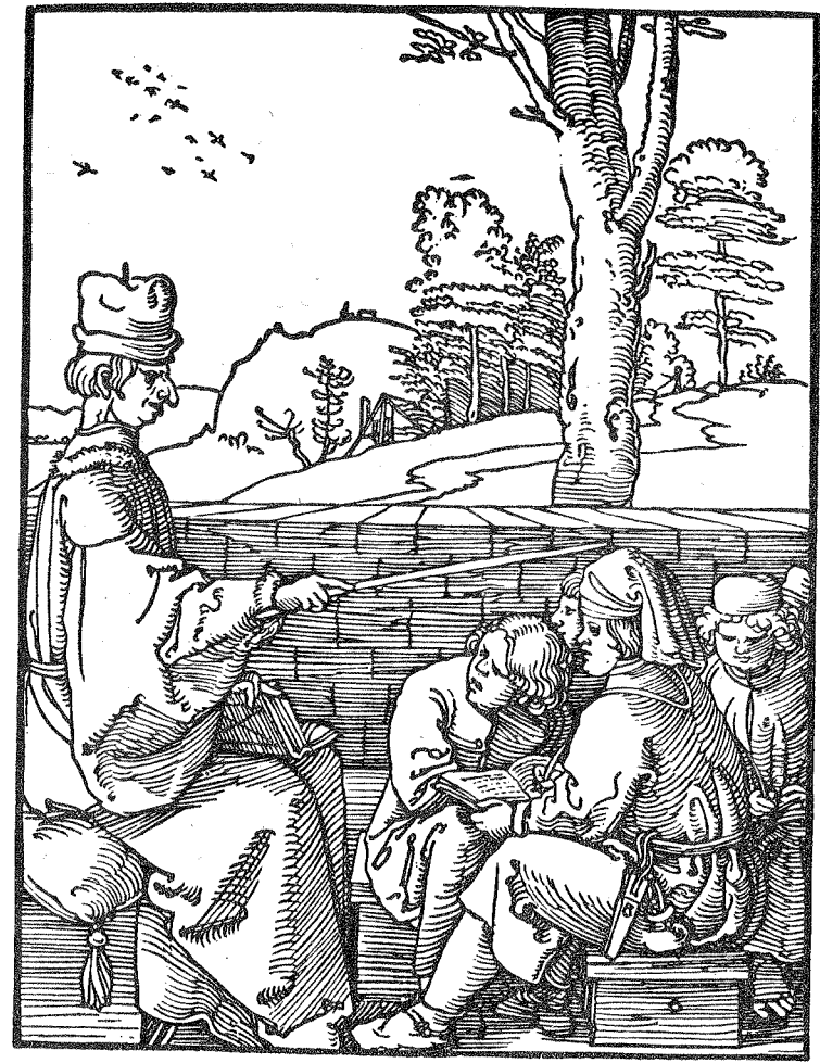
La red de Jonás